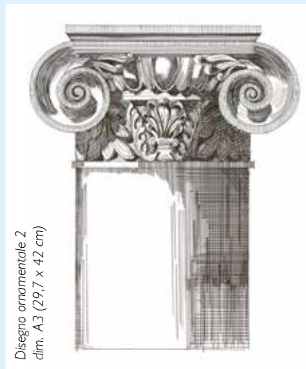
Disegno ornamentale 2 dim. A3 (29,7 x 42 cm)

Nel giugno 2014 ho conseguito una maturità professionale artistica e un attestato di capacità come pittrice di scenari. Purtroppo, la difficoltà nel tro-