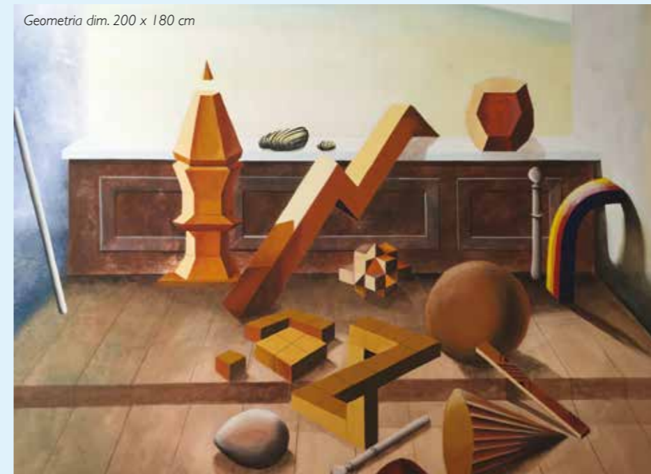
Geometria dim. 200 x 180 cm

nella vita, come quello di voler combinare arte e scienza. Questo è uno dei motivi principali che mi ha portato alla decisione di studiare a Zurigo, città in cui la facoltà di "Scientific Visualisation" è conosciuta e inseguendo così anche il mio sogno di diventare illustratrice scientifica.