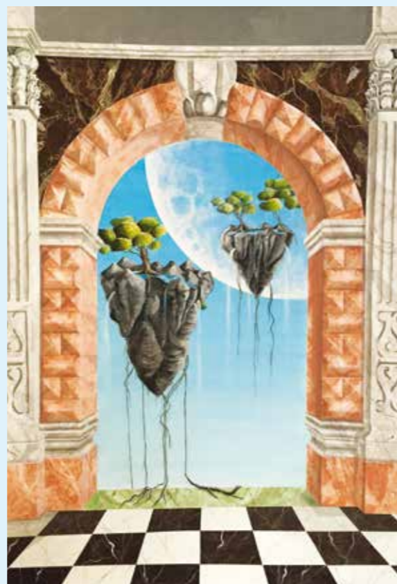
Portone dim. 180 x 200 cm

A mio avviso, questo oggi non viene fatto e ad aggravare la situazione si aggiunge la scarsa comunicazione da parte dello CSIA verso gli allievi, mediante servizi di orientamento scolastico. Chiaramente sta poi all'individuo informarsi e cercare di trovare la propria strada. Prima di terminare la scuola ho passato mesi a cercare università