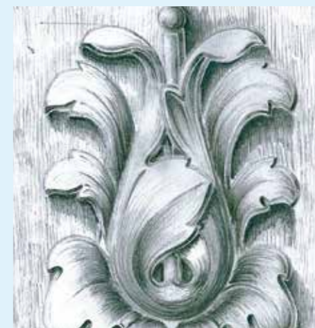
Disegno ornamentale dim. A3 (29,7 x 42 cm)

In quegli anni ho imparato, insieme alle mie compagne di studio, come com-