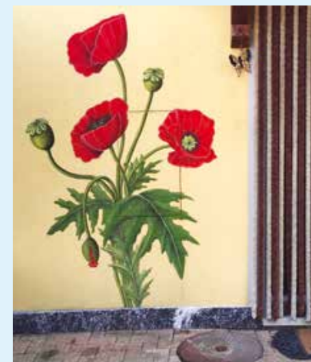
Papavero dim. 120 x 200 cm

Sono molto contenta di aver frequentato una scuola che mi ha dato solide basi artistiche e buone capacità pittoriche e sono cosciente del fatto che questa esperienza mi abbia portato ad essere la persona che sono oggi.