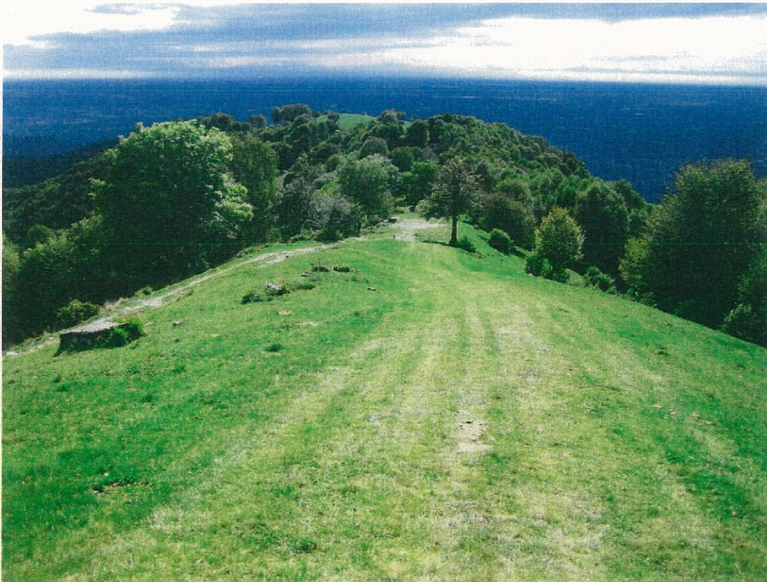
Prati del Monte Bisbino, uno dei biotopi ideali della Trombicula